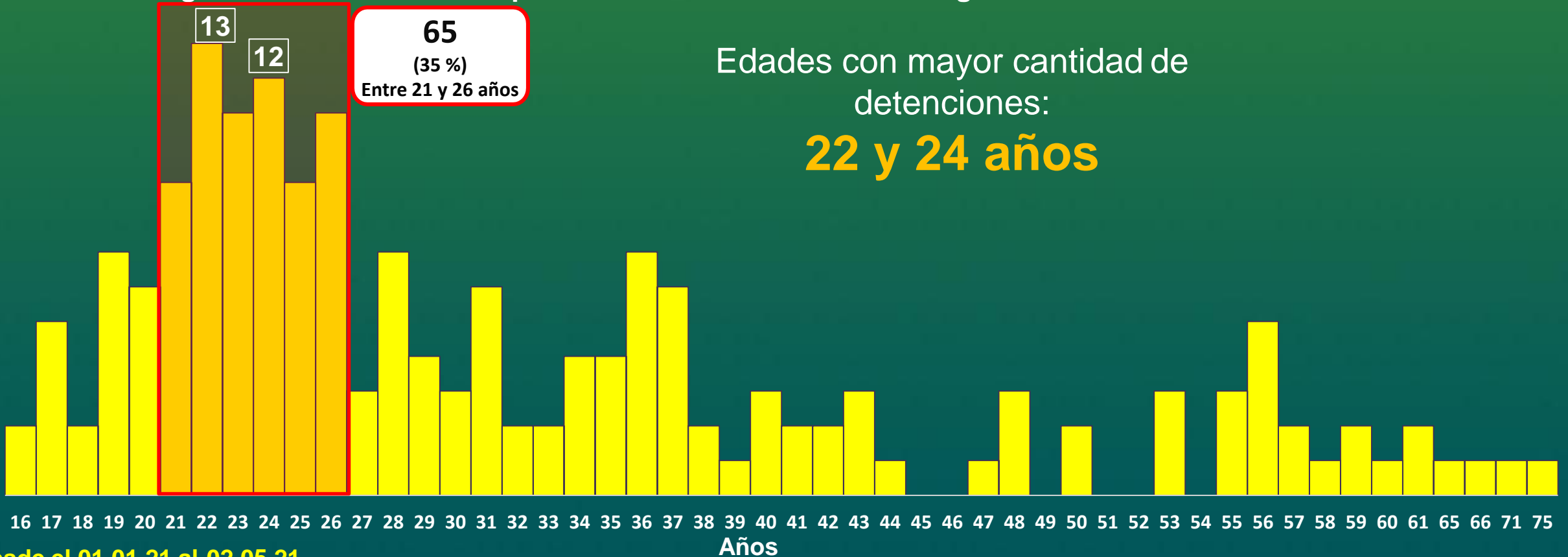
Gráfica de rangos etarios de detenidos por reuniones masiva a nivel regional